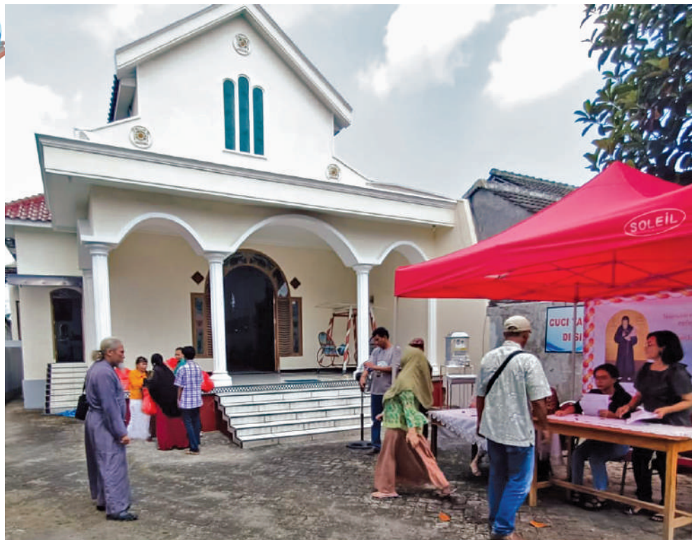
Διανομή τροφίμων στον Ἱερό Ναό Κοιμήσεως τῆς Θεοτόκου στό Γκουνούνγκ Γκενταγκάν

φίλους καί δωρητές τοῦ Ἱεραποστολικοῦ Συνδέσμου καί στίς οἰκογένειές τους γιά τήν μεγάλη αὐτή εὐεργεσία.