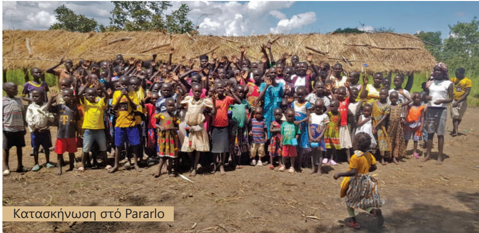
Κατασκήνωση στό Pararlo

Ἐνα ἄλλο μεγάλο πρόβλημα πού ἀντιμετωπίζουμε εἶναι ἡ ἔλλειψη πόσιμου νεροῦ, ἰδιαίτερα στά χωριά τῆς ἐπαρχίας. Σταδιακά σκοπεύουμε νά κατασκευάσουμε γεωτρήσεις στό προαύλιο τοῦ Ἐπισκοπείου καί σέ ὅλες τίς ὑπό ἴδρυση Ἐνορίες, ὥστε νά ἀνακουφίσουμε τόν κόσμο πού ἀναγκάζεται νά διανύει μεγάλες ἀποστάσεις πρὸς ἀναζήτηση πόσιμου νεροῦ, γιατί διαφορετικά εἶναι πολλοί αὐτοί πού κινδυνεύουν νά πεθάνουν ἀπό λειψυδρία.