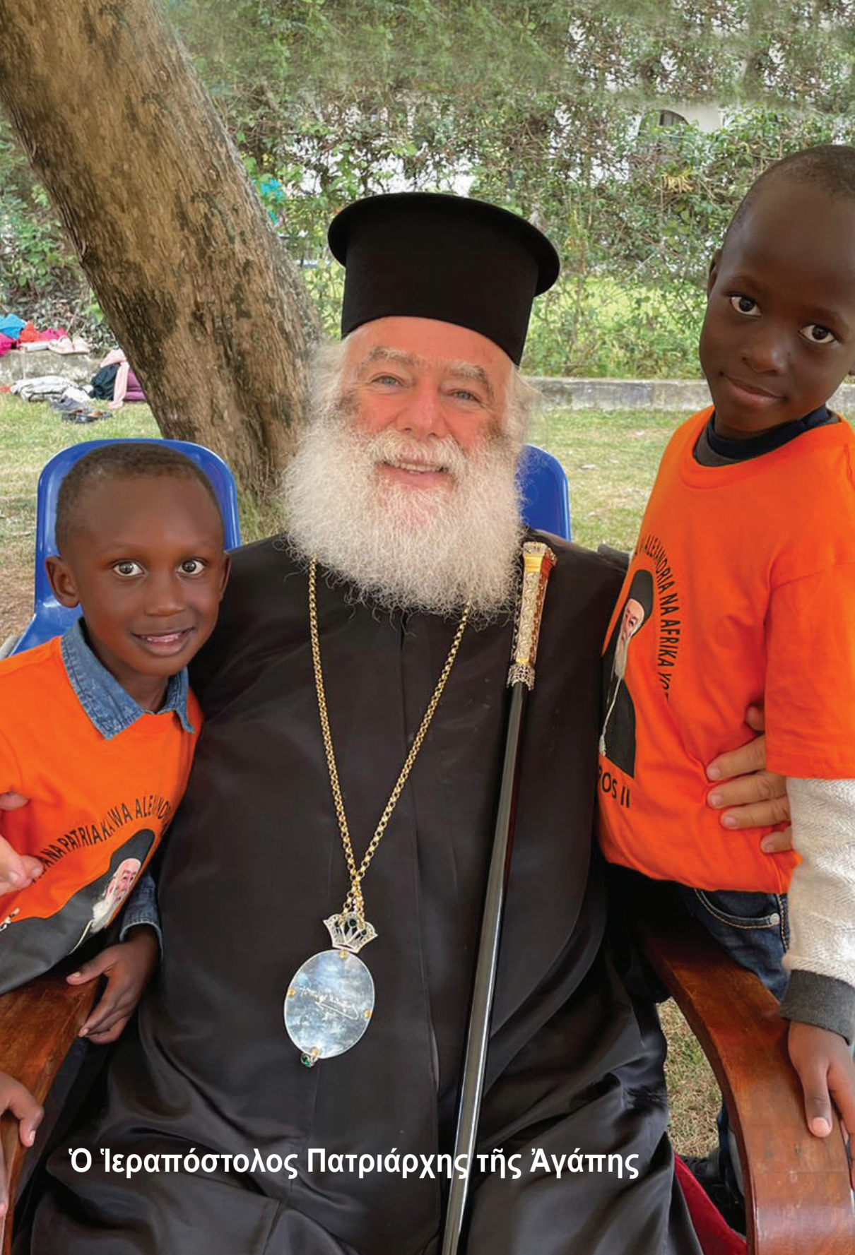
Ὁ Ἱεραπόστολος Πατριάρχης τῆς Ἀγάπης