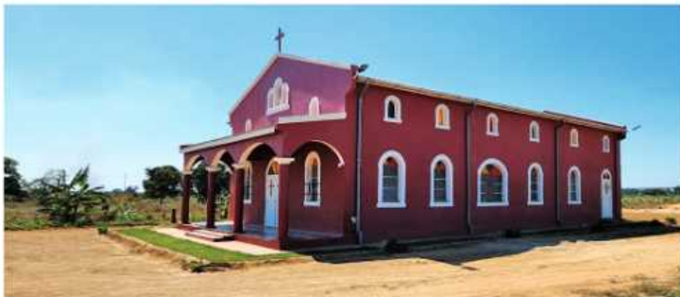
Ὁ Ἱερός Καθεδρικός Ναός τῶν Ἁγίων Σιλουανοῦ τοῦ Ἀθωνίτη καί Σωφρονίου τοῦ Ἑσσεξ

δεισιδαιμονιῶν. Ἡ ἔκταση τοῦ ἔργου καί οἱ ἀνάγκες πολλές, ἡ χάρη ὁμως τοῦ Κυρίου ὡς δρόσος περίσσεψε, στέλνοντας τά βήματά σας κοντά στήν δική μας μοναχική πορεία.