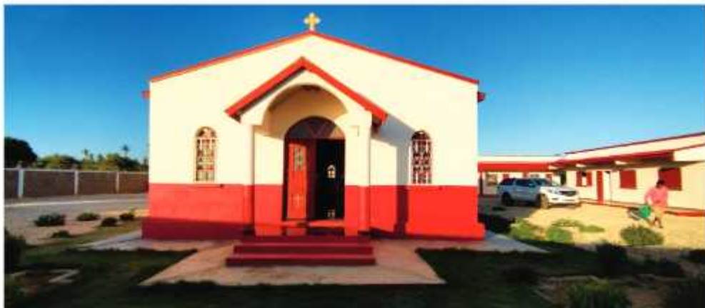
Τό Καθολικό καί τά κελλιά τῆς Ἱερᾶς Μονῆς τοῦ Ὁσίου Ἰωσήφ τοῦ Ἡσυχαστοῦ

στάτες τοῦ ιεραποστολικοῦ ἔργου τῆς Ἱερᾶς Ἐπισκοπῆς μας. Οἱ τρεῖς αὐτοὶ Ἅγιοι ὁδήγησαν ἐσᾶς νά πράξετε τόσα πολλά. Καί αὐτούς τοὺς τρεῖς Ἁγίους παρακαλῶ νά γεμίζουν τό διάβασας μέ φῶς Χριστοῦ ἕως τόν παράδεισο.