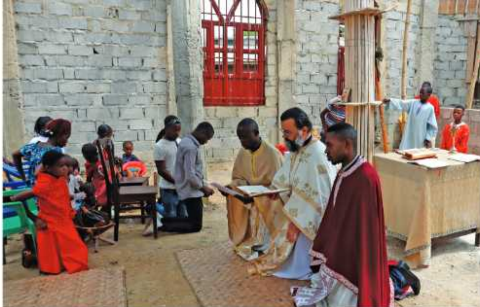
Πεντηκοστή στον νεοαναγειρόμενο Ίερό Ναό τῆς Ἁγίας Ἄννας στό Κισανγκάνι